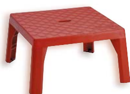
Code: 580110 Réf.: ST-45