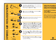
Code Réf. ES: X690170 PA-29P E ING: X690171 PA-29P I FR: X690172 PA-29P F