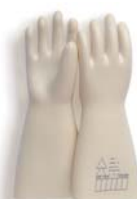
Code: 530270 Réf.: SG-30 T9